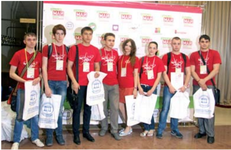
Авторы проекта «Донорство»

– Вся наша команда – это студенты Волгодонского МИФИ, – рассказал корреспонденту «Парламентского вестника Дона» студент 3-го курса